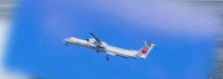
これで来てね♡ DH4 50座席