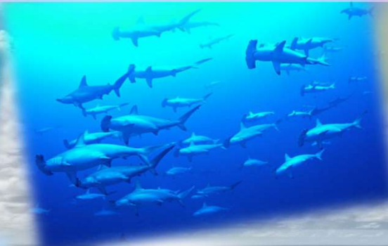
ハンマーヘッドシャークの大群