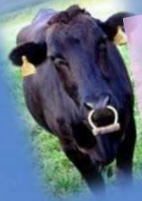
牛もいます 黒毛和種 🐮